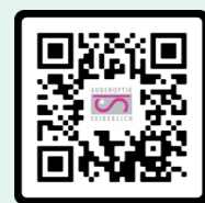
Online Termin Tool

Augenoptik Seiberlich Reichsstr. 23 · 04552 Borna Telefon: 03433 204115 E-Mail: info@augenoptik-seiberlich.de www.augenoptik-seiberlich.de